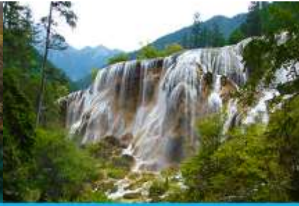
น้ำตกธารไข่มุก