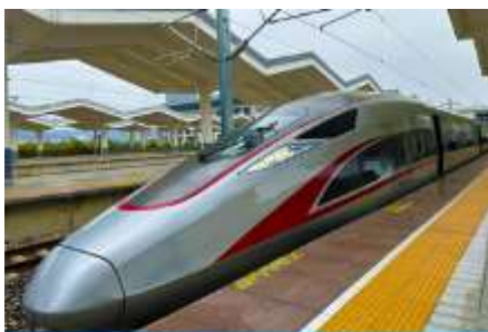
เมืองรถไฟความเร็วสูง

พักที่ XINGYU INTERNATIONAL หรือ โรงแรมระดับ 4 ดาวท้องถิ่น