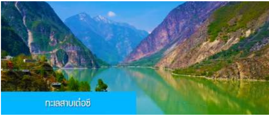
ทะเลสาบเต๋อซี