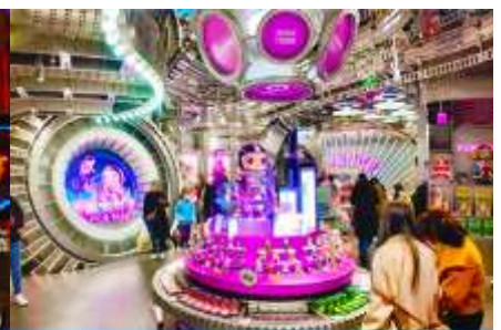
ร้าน POP MART

วันที่ห้า จิวจ้ายโกว-เงินเจียงกวน-ขึ้นรถไฟความเร็วสูง-นครเฉิงตู-ช้อปปิ้งถนนชุนชิวร้าน POP MART