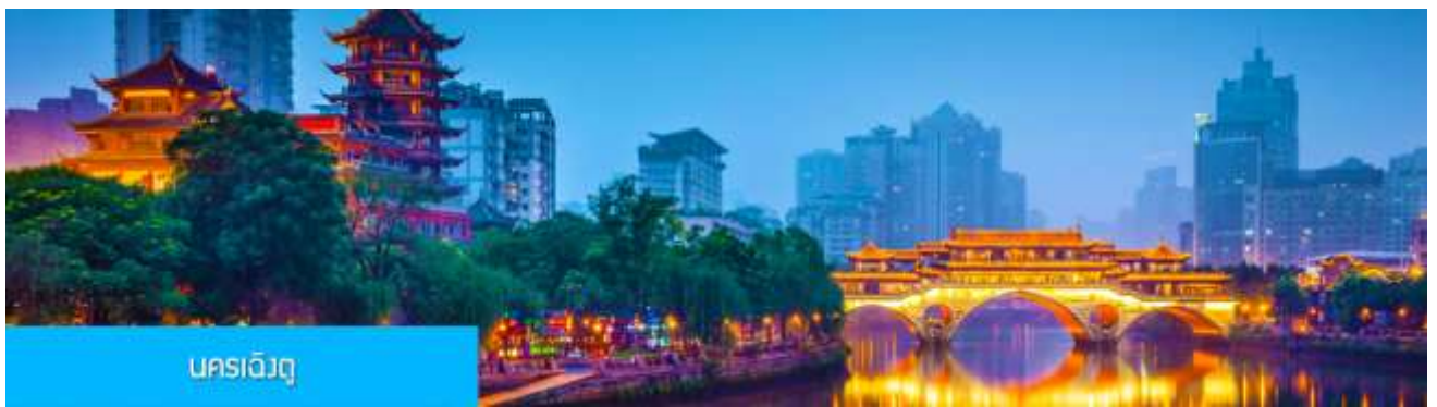
นครเฉิงตู