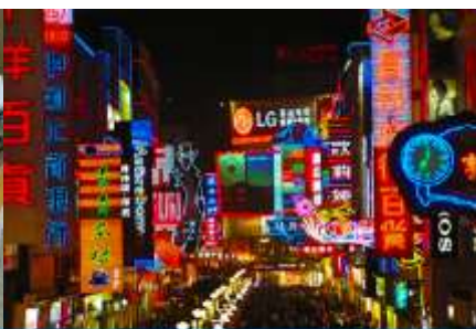
ถนนคนเดินซุนชิว