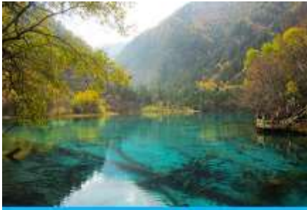
อุทยานจิวจี้โกว